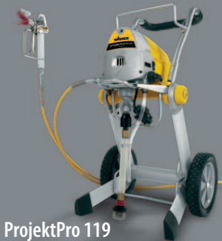
| ProjektPro 119