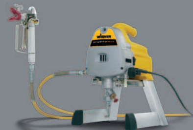
| ProjectPro 117