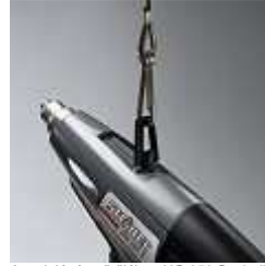
Annak lógó gyűrűjében HG 350 S mindig könnyen megközelíthető a rendkívüli helyzetekben munka