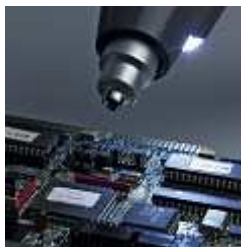
Beépített LED fény