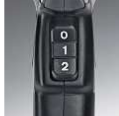
Kényelmesen elhelyezett ellenőrző kapcsoló beállítás OFF / hideg / meleg