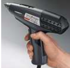
Optimalizált súly egyensúlyt biztosítja a fáradtságmentes munkahely