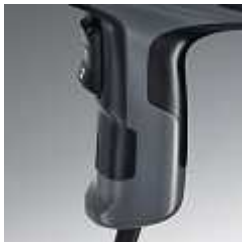
Az ergonomikusan kialakított markolat fogantyú biztosítja a kényelmes kezelhetőséget