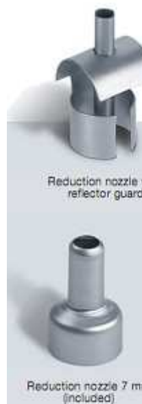
Reduction nozzle reflector guard