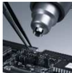
Ideális a de-forrasztás elektronikai alkatrészek