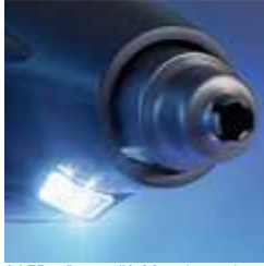
A LED erős megvilágítást ad a munkaterületen, és egyúttal a jelzőlámpa